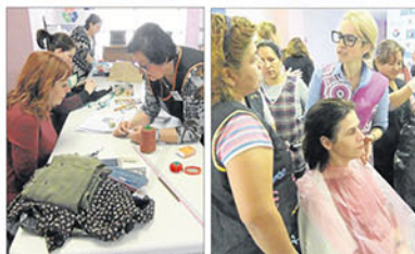
Proyectos como el servicio de contenedores, el apoyo escolar o talleres de peluquería y costura.

20 años en Alicante Recicla-Alicante celebra 20 años en la provincia trabajando conjuntamente con ayuntamientos y otras ONG «creemos en el trabajo en red. Solo podemos hacer muchas cosas pero juntos llegamos más lejos». En colaboración con varias Cáritas de la provincia se están beneficiando un gran número de familias. «Somos un grupo de trabajo con los que cuenta la ONG y todos ellos comprometidos con la labor y el compromiso adoptado por Recicla-Alicante en cada uno de los proyectos. Desde hace 12 años en delegación de la Asociación Alcantarina de Familias Numerosas en la Vega Baja, ofreciendo servicio de atención y asesoramiento a estos núcleos familiares. También oficina técnica de la Asociación Alcantarina de Escuelas Múltiple Vega Baja y asesoramos a cinco asociaciones locales y comarcales. Recicla-Alicante trabaja con un gran número de ayuntamientos de la provincia pero, «estamos abiertos a llegar a otras localidades para seguir desarrollando nuestra labor». Más información: www.reciclaalicante.org Teléfono: 96 674 39 33 email: info@reciclaalicante.org