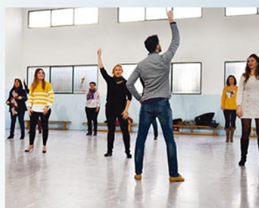
Baile en Benferri