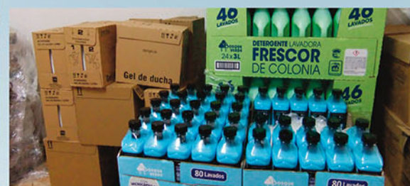
Entrega productos de higiene en Redován