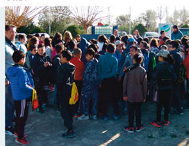
Día del árbol en Almoradí