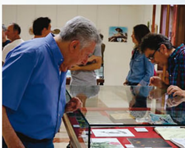
En el IV Festival Natura y Día de los Humedales de Novelda