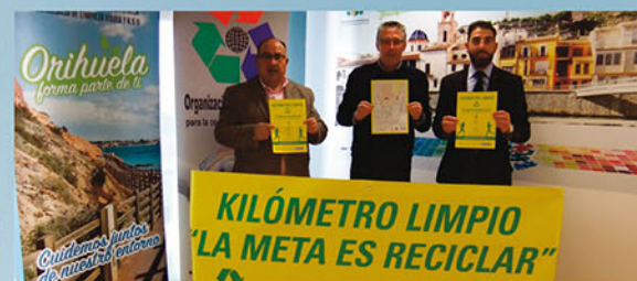
Colaborando con el reciclaje en Orihuela