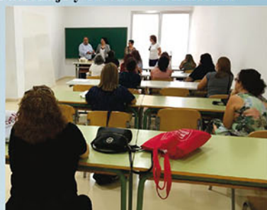
Patronaje y costura en Bigastro