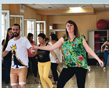
Baile en Algorfa