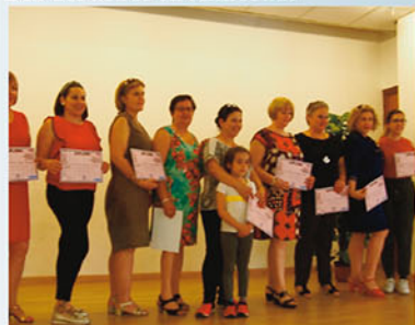
Patronaje y costura en Redován

Gracias a la firma de estos convenios los vecinos se benefician de talleres de patronaje y costura o baile. Recicla-Alicante también colabora en otras actividades puntuales que se van organizando a lo largo del año.