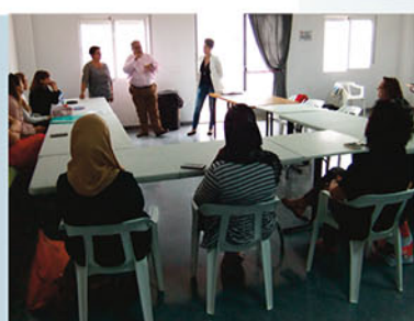
Patronaje y costura en Almoradí

Gracias a la firma de estos convenios los vecinos se benefician de talleres de patronaje y costura o baile. Recicla-Alicante también colabora en otras actividades puntuales que se van organizando a lo largo del año.