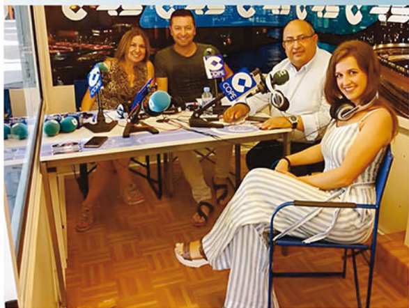
En el estudio móvil de Cope Sureste haciendo el programa desde Almoradí.

Veinte años de trabajo han dado para mucho. Tanto es así que quisimos compartirlo. A Recicla-Alicante se le conoce por toda la provincia alicantina pero salir en los medios de comunicación también es acercarnos a quienes podemos ayudar y no nos conozcan. Así que comenzamos por Activa Orihuela y finalizamos con Diario Información, eso sí, pasando por varios medios que siempre están cuando los necesitamos.