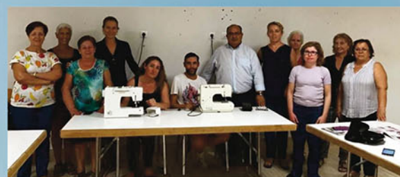
Patronaje y costura en Mutxamel