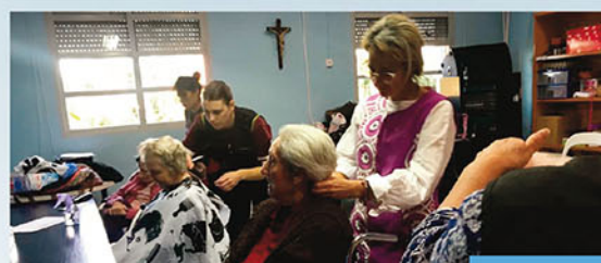
Peluquería en el Centro de Mayores de Benejúz